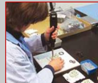
Montaż i nadruk

Park maszynowy naszych zakładów produkcyjnych składa się z 42 wtryskarek od 10 T do 700 T siły zamykania.